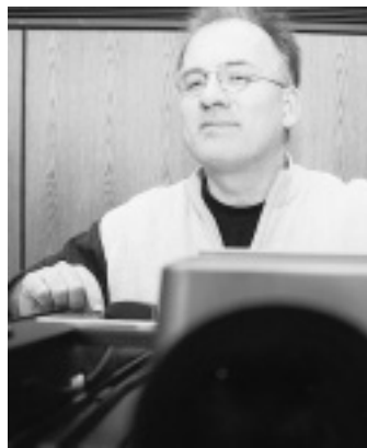
Am Diaprojektor: Der 40-Jährige erzählte von seinen Abenteuern.

Von der pulsierenden Millionenstadt Vancouver führte es den Weltenbummler (und seine Zuschauer) bis in den menschenleeren Norden von British Columbia und in das Yukon Territorium. „Das bereiste Gebiet ist mehrmals so groß wie die Bun-